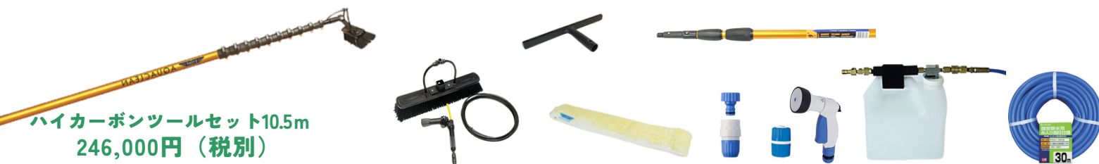
ハイカーボンツールセット10.5m 246,000円（税別）